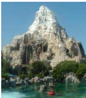
Matterhorn in Disneyland

Ik haal dit alleen aan om te laten zien dat je, zo gauw je je af gaat vragen wat de ultieme werkelijkheid is, meteen onzin gaat debiteren. Zeno bewees dat beweging onmogelijk was (in feite verbeeldde hij zich alleen dat hij dat bewezen had; wat hij miste was wat technisch de “grenstheorie” heet). David Hume, de allergrootste scepticus, vertelde ooit dat na een bijeenkomst van sceptici waar zij waarheidsgetrouwheid van het scepticisme als filosofie wilden verkondigen, alle aanwezigen desalniettemin via de deur weggingen en niet door het raam. Ik begrijp wat Hume bedoelt. Het was gewoon allemaal geleuter. Die ernstige filosofen namen wat ze zeiden zelf niet serieus.