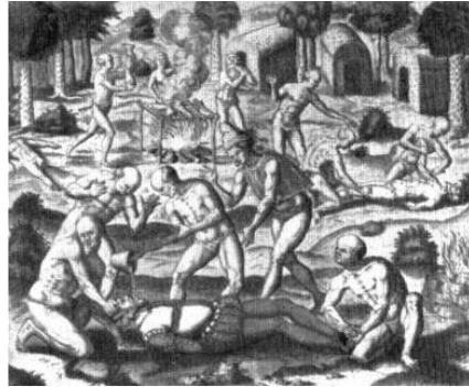
Indianen gieten gesmolten goud in de mond van een Spanjaard