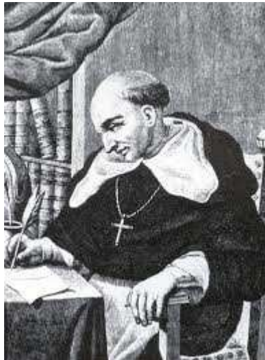
BARTHELOMÉ DE LAS CASAS 1484-1566

oorspronkelijk gepubliceerd in Sevilla in 1552.